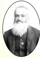
Sir William Muir